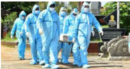
കോവിഡ് മരണം കൂടുതൽ ആദ്യ തരംഗത്തിൽ; 27,202