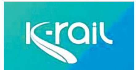
സിൽവർലൈനിന് അമിത തിടുക്കം; മറ്റു പദ്ധതികൾ ഇഴയുന്നു