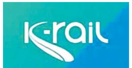
സിൽവർലൈനിന് അമിത തിടുക്കം; മറ്റു പദ്ധതികൾ ഇഴയുന്നു