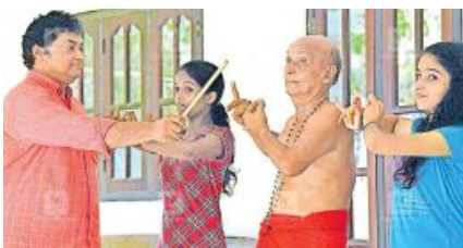
പ്രായത്തിനുമേൽ കഥകളി പുറപ്പാട്