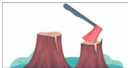
മുട്ടിൽ കേസിലെ ഉദ്യോഗസ്ഥന്റെ പുതിയ നിയമനം മുഖ്യന്റെയും വനം മന്ത്രിയുടെയും അറിവോടെ