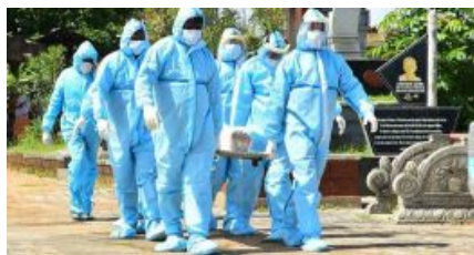
കോവിഡ് മരണം കൂടുതൽ ആദ്യ തരംഗത്തിൽ; 27,202