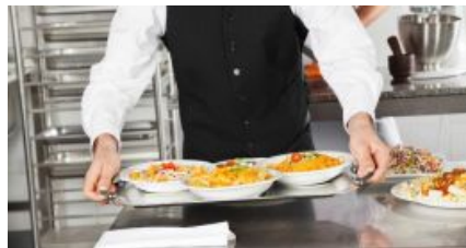
സർക്കാരിനു ചൂടാക്കിയെടുക്കാൻ പഴയൊരു ബിൽ ഫ്രീസറിലുണ്ട്