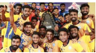
വീണ്ടും ചരിത്രമെഴുതി കാലിക്കറ്റ് വാഴ്സിറ്റി