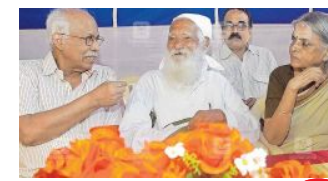
പരിഷത്തിന് മാർഗം തെളിച്ചു