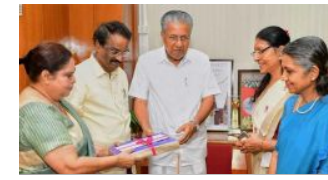
ഹോമ കമ്മിറ്റി ശുപാർശ പുറത്തുവരട്ടെ