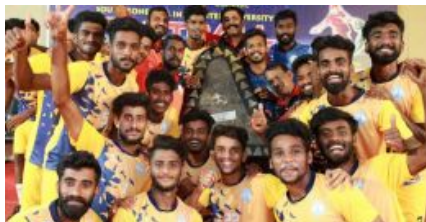
വീണ്ടും ചരിത്രമെഴുതി കാലിക്കറ്റ് വാഴ്സിറ്റി