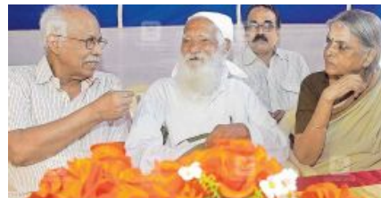
പരിഷത്തിന് മാർഗം തെളിച്ചയാൾ